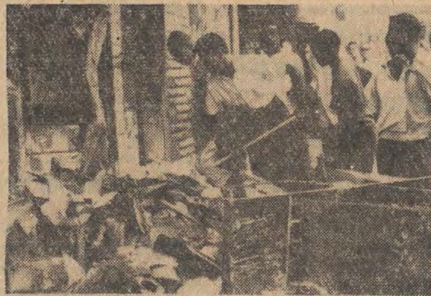
Na zdjęciu: w mieście Toledo robotnicy miejscy przy współpracy miejscowej ludności usuwają skutki niedawnych zamieszek.

Związek Radziecki wprowadził 31 lipca br. na orbitę wokółziemską sztuczne satelity naukowe z serii „Kosmos” – z kolejnym numerem 170.