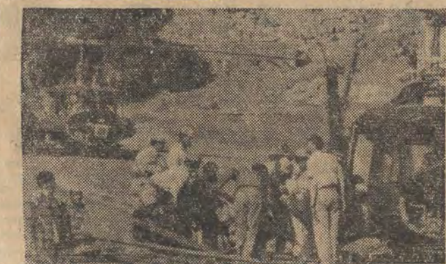
Z miejscowości Pulmur we wschodniej Turcji startują helikoptery wojskowe przewożące żywność, ubrania i lekarstwa do Anatolii, która kilka dni temu nawiedzona była trzęsieniem ziemi.

Około 200 ofiar ludzkich pochłonęły dwa ostatnie trzęsienia ziemi w Turcji – jedno w górach na wschodzie tego kraju, a drugie w pobliżu miasta Adapazari, położonego o 160 km. na wschód od Stambułu. W samym Stambule wstrząs sejsmiczny, jaki dał się odczuć w poniedziałek o 7.15 czasu miejscowego, nie pociągnął za sobą większych szkód.