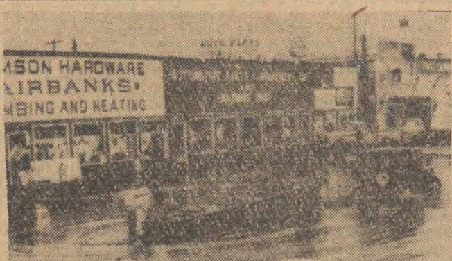
oto jedna z ulic miejscowości Fairbanks na Alasce. Miejscowość ta niemal całkowicie zalana została przez wody rzeki Chena.