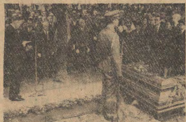
Pogrzeb ministra gospodarki komunalnej — Stanisława Sroki. Nad trumną przemawia wicepremier Piotr Jaroszewicz.

w Śali Kolumnowej Pałacu Prymasowskiego, O godzinie 14 trumna zostaje