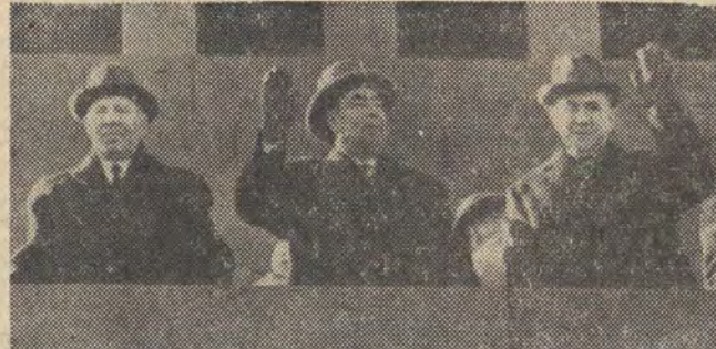
Na zdjęciu: przywódcy radzieccy odbierają defiladę na Mauzoleum Lenina. Od lewej: N. Podgorny, L. Breżniew i A. Kosygin.

Na krótko przed godziną 10 czasu moskiewskiego na trybunie honorowej zajmują miejsca przywódcy partii i kierownicy państwa radzieckiego — L. Breżniew, A. Kosygin, N. Podgorny, M. Susłow i inni. Wraz z nimi — przewodniczący delegacji partyjno-rządowych krajów socjalistycznych, a wśród nich Władysław Gomułka i Jozef Cyrankiewicz, przewodniczący delegacji partii komunistycznych i robotniczych, postępowych organizacji i ruchów społecznych, organizacji międzynarodowych, postępowych państw afrykańskich oraz premier Indii — Indira Gandhi i prezydent Finlandii