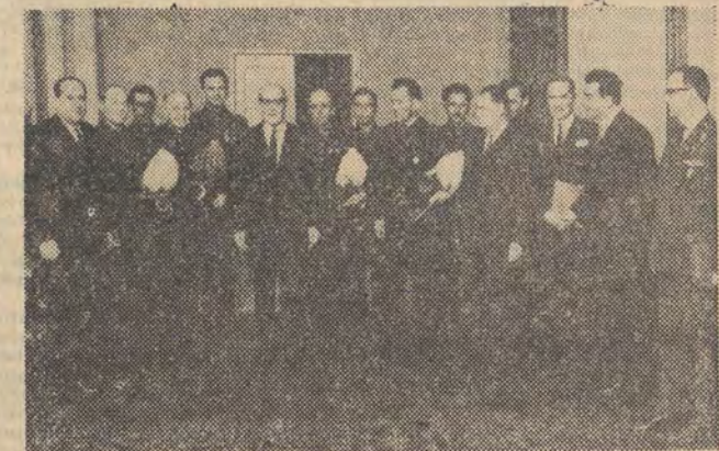
Na zdjęciu: Władysław Gomułka z delegacją górników.