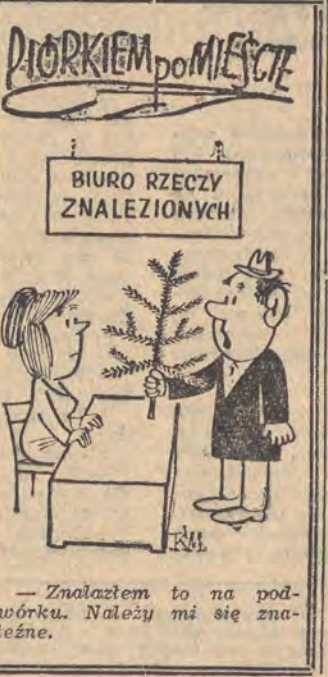
— Znalazłem to na podwórku. Należy mi się znać.

ZAUWAŻYLIŚMY Wczoraj... ...kilka brygad robotników przy odnawianiu i naprawie niektórych neonów reklamowych, m. in. na ul. Narutowicza i Piotrkowskiej. Czas na to najwyżej, bo stan ich daleko odbiega od zadowalającego, a tamielówki typu „wer sal”, czy też „on kr...eckii”, już się wszystkim znudziły. (er)