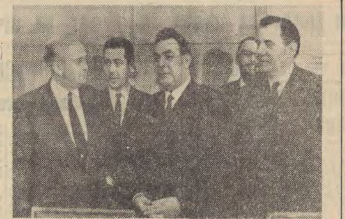
Na zdjęciu: od lewej - Harold Wilson, Leonid Breżniew i minister spraw zagranicznych ZSRR - Andrej Gromyko.

Sekretarz generalny KC KPZR Leonid Breżniew przyjął we wtorek rano premiera Wielkiej Brytanii Harolda Wilsona. Leonid Breżniew i Harold Wilson wymienili poglądy na niektóre aktualne problemy sytuacji międzynarodowej oraz na sprawy związane ze stosunkami między ZSRR i Wielką Brytanią.