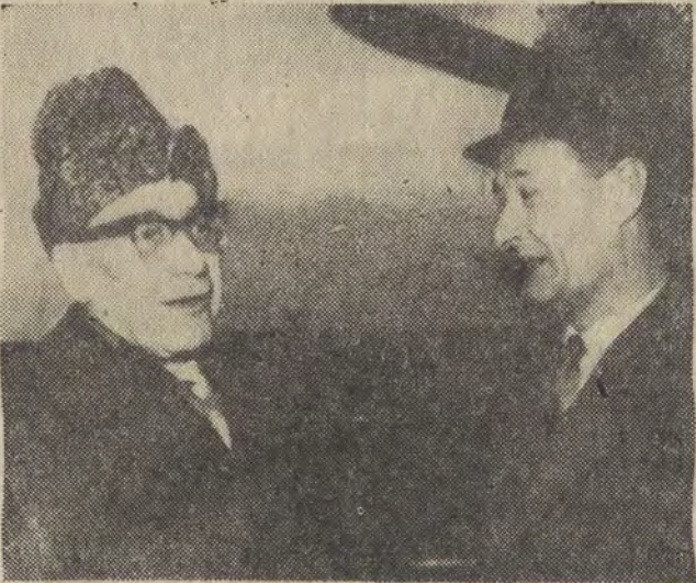
Na zdjęciu: I sekretarz KC KPCz A. Dubczek wita Wł. Gomułkę na lotnisku ostrawskim.

Na zaproszenie Komitetu Centralnego Komunistycznej Partii Czechosłowacji w dniu 7 bm. odwiedził CSRS I sekretarz KC PZPR Władysław Gomułka i w Ostrawie spotkał się z I sekretarzem KC KPCz, Aleksandrem Dubczkiem.