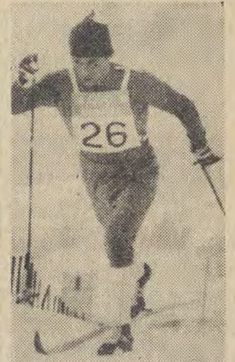
Na zdjęciu: Nones na trasie biegu.

Wczoraj na Igrzyskach Olimpijskich odbyła się w Autrans pierwsza narciarska konkurencja — bieg na 30 km mężczyzn. Zakończyła się ona sensacyjnym zwycięstwem 27-letniego biegacza Włoch, Franco Nones.