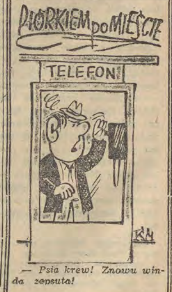
— Psia krew! Znowu wiada zepsuta!

EKONOMIKA. K. Krajski - Ekonomiczne podstawy planowania rozwoju galezi przemysłu maszynowego. PWE, str. 156, zł 11. J. Górski - Zarys historii ekonomii politycznej. KiW, str. 430, zł 25. G. Missalowa - Studia nad powstaniem Łódzkiego Okręgu Przemysłowego 1815-1870. WL, str. 200, zł 45. Al. Paszyński - Ludzie, miasta, mieszkania. PWE, 1967 r. Seria: „Wszystko o gospodarce“, str. 100, zł 6. J. Tarski - Transport jako czynnik lokalizacji produkcji. PWE, str. 390, zł 25. K. Kwiatkowski - Produkcyjne zachowanie jednostki w zespole pracowniczym. PWE, str. 180, zł 13.