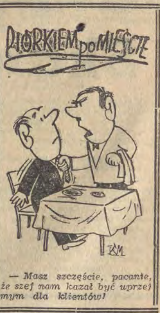
- Masz szczęście, panie, że szef nam kazał być uprzejmym dla klientów!