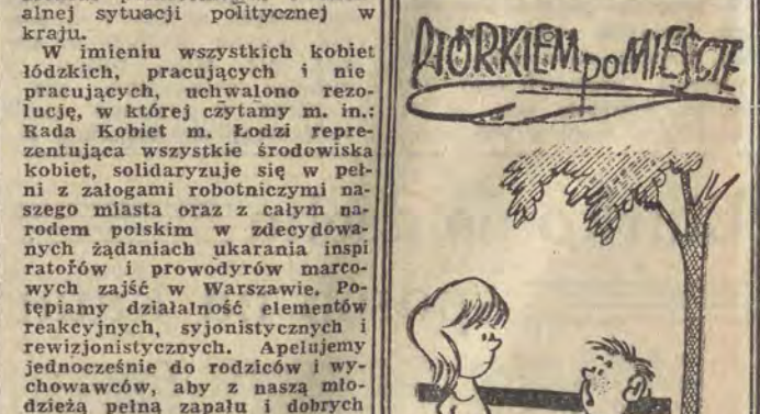
— Pani wybacz, że pani nie podrywam, ale muszę uważać, bo milicja wypatruje wagarowiczów!

intencji — podejmowano dyskusje, wyjaśniano absorbujące ją problemy ideowo-polityczne, moralne i światopoglądowe”. (Kas.)