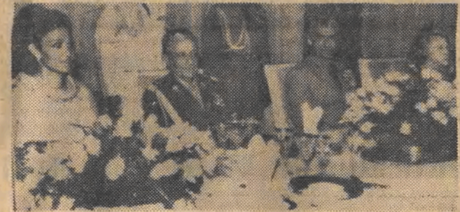
3 bm. szachinszach Iranu — R. Pahlavi i cesarzowa Iranu — Farah Pahlavi wydalali na cześć przewodniczącego Rady Państwa PRL — M. Spychalskiego i jego małżonki bankiet w pałacu Niaravan.

Wczoraj przewodniczący Rady Państwa marszałek Polski M. Spychalski z małżonką wydalali w salach pałacu Golestan przyjęcie, na