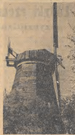
w Jegłowniku k/Elbląga.