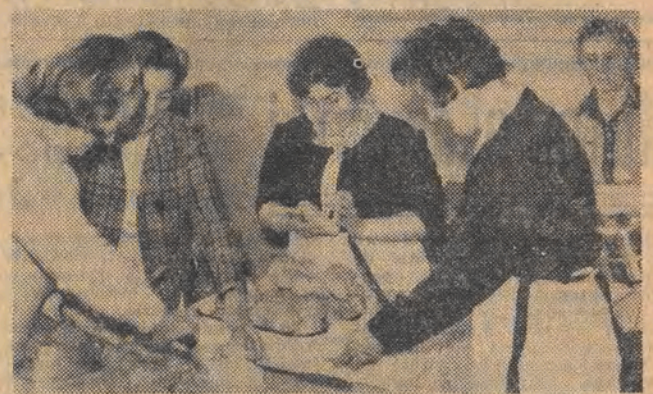
Matura od kuchni — mamy przygotowały apetyczne drugie śniadanie.

udziela ostatnich wskazówek i za chwilę cała gromadka wchodzi do auli, gdzie ustawiono rzędami stołeczki, a na każdym z nich karteczka z imieniem i nazwiskiem abiturientki oraz kwiatek. Przed otwarciem koperty z tematami wszyscy wstrzymują oddech. Kiedy profesor odczytuje je — cisza jak makiem zasiał. Za chwilę tematy pisze się na tablicy. Teraz trzeba się dobrze zastanowić, który z nich wybrać.