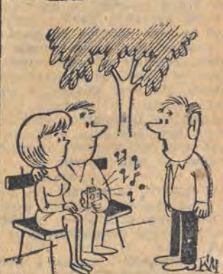
— Czy mogę panią prosić do tańca?