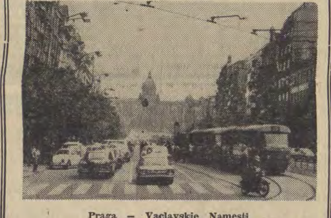
Praga — Vaclavskie Namesti

NA LAWIE OSKARŻONYCH trzej młodzi chłopcy. Akt oskarżenia zarzuca im, że „dnia... wsiadli do zaparkowanego na ulicy samochodu, uruchomili go i pojechali na wycieczkę... Dojechali do miejscowości... gdzie zabrakło im benzyny”. Tam zostawili samochód i do domu wrócili autobusem.