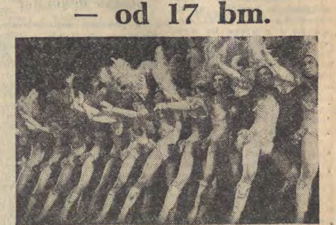
Na zdjęciu — jeden z „line dances”.

W dniach 17-22 bm. występuje w Hali Sportowej Wielka Rada Japońska o egzotycznej nazwie „Nippon Kageki Dan”. Zespół specjalizuje się w programach o charakterze europejskim. Przebojem jego są, wzorowane na rewiach francuskich „tańce liniowe” wykonywane przez 40 tancerki.