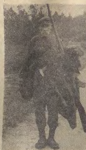
Wyrobnik poszukujący pracy

Produkcja rolnicza w Wielkopolsce i na Pomorzu, przemysłowa w b. zaborze rosyjskim i na Śląsku na- stawione były na rynku zbytu, mieszczące się poza te- renem objętym granicami RP. O głębokości tego po- dziętu może świadczyć fakt, że w 1914 roku zaledwie 10 proc. handlu Ziem Zachodnich dotyczyło obrotów z pozostałymi „dzielnicami” Polski. Wielkopolskie browary, cukrownie i magazyny zbożowe czekały na kon- trahentów w Berlinie; łódzkie włókiennictwo, warszaw- ska metalurgia i fabryki Zagłębia czekały na kupców z Rosji, z Dalekiego Wschodu. Do takich kierunków importu (i eksportu) dostosowane były linie kolejowe: brak było bezpośredniego połączenia Warszawy z Poz- naniem, Śląska z Wybrzeżem. Jeszcze w 1919 roku obieg miały trzy różne waluty, jeszcze w 1920 roku Poznańskie odgródzone było od reszty kraju odrębna granicą celną.