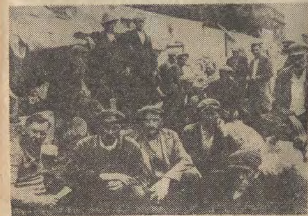
Strajk okupacyjny sezonowców w Pabianicach w 1936 r.

Produkcja rolnicza w Wielkopolsce i na Pomorzu, przemysłowa w b. zaborze rosyjskim i na Śląsku na- stawione były na rynku zbytu, mieszczące się poza te- renem objętym granicami RP. O głębokości tego po- dziętu może świadczyć fakt, że w 1914 roku zaledwie 10 proc. handlu Ziem Zachodnich dotyczyło obrotów z pozostałymi „dzielnicami” Polski. Wielkopolskie browary, cukrownie i magazyny zbożowe czekały na kon- trahentów w Berlinie; łódzkie włókiennictwo, warszaw- ska metalurgia i fabryki Zagłębia czekały na kupców z Rosji, z Dalekiego Wschodu. Do takich kierunków importu (i eksportu) dostosowane były linie kolejowe: brak było bezpośredniego połączenia Warszawy z Poz- naniem, Śląska z Wybrzeżem. Jeszcze w 1919 roku obieg miały trzy różne waluty, jeszcze w 1920 roku Poznańskie odgródzone było od reszty kraju odrębna granicą celną.