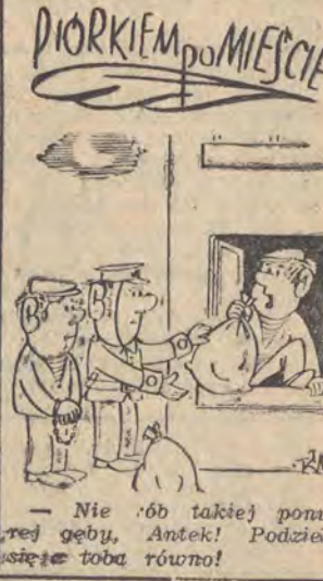
Nie ob takiej ponurej gęby, Antek! Podziękuj mi za tobie równo!

Pomysł interesujący. Jego realizacja istotnie przyczyni się do upowszechnienia teatru lalek w naszym mieście.