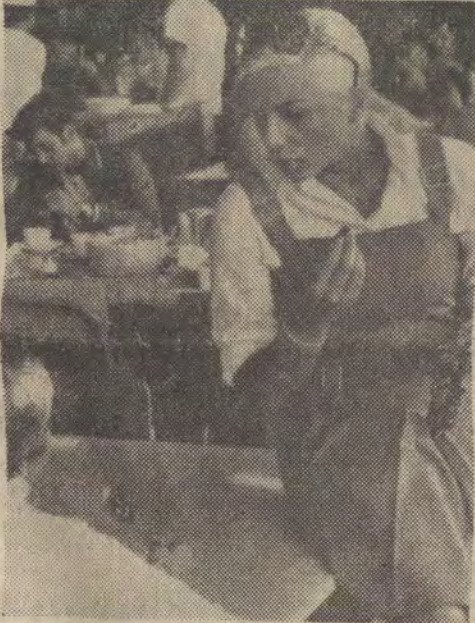
Na zdjęciu: znana komitka pływaczka francuska Christine Caron, pretendująca do olimpijskiego medalu.

Meksyk przed Olimpiadą. W wiosce olimpijskiej życie toczy się normalnym, sportowym trybem - treningi, zwiedzanie miasta, wymiana autografów.