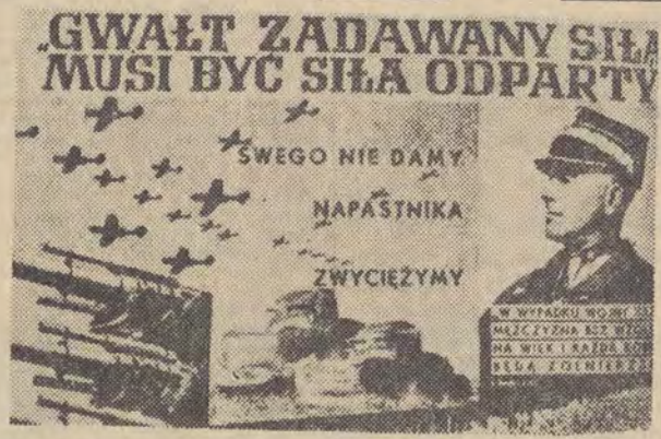
Plakat propagandowy z 1939 r.