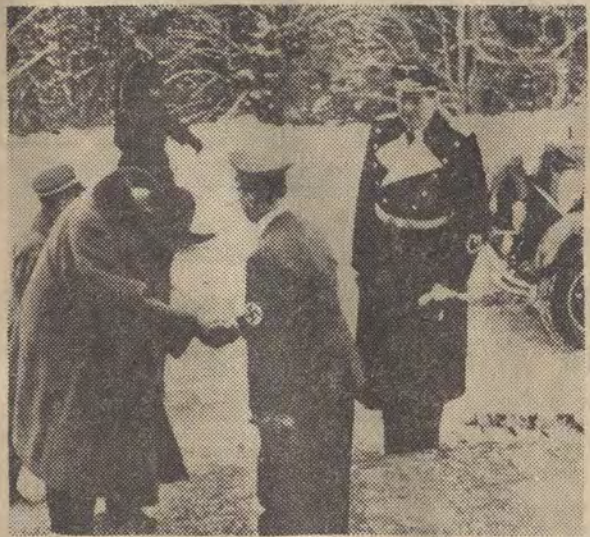
Beck z wizytą u Hitlera w Berchtesgaden 5.I. 1933 r.

Dowodnie okazało to zawarty jesienią 1925 roku tzw. Pakt Reński w Locarno: gwarantował on granice zachodnie... ale Niemiec, nie Polski. Stosunki polsko-niemieckie były, właściwie od początku istnienia II Rzeczypospolitej, napięte. W latach 1920—1922 trwał bójkot handlu polskiego, w połowie 1925 roku rozpoczęła się — formalnie trwająca aż do 1934 roku — wojna celna. Pomorze i Śląsk... a przede wszystkim Górniki były punktami zapalnymi. Bez Śląska i bez Pomorza Polska jako państwo samodzielne w praktyce nie mogłaby egzystować — o nic też więcej nie chodziło niemieckim nacjonalistom.