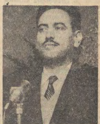
Mohammad Yid Aszaul

W środę, w trzecim dniu oficjalnej wizyty w naszym kraju, minister spraw zagranicznych Arabii Syryjskiej Mohammad Yid Aszaul został przyjęty przez prezesa Rady Ministrów Józefa Cyrankiewicza. Kontynuowane były również rozmowy polsko-syryjskie w Ministerstwie Spraw Zagranicznych.