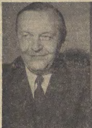
2. JERZY MUSZYŃSKI — I sekretarz KW PZPR w Łodzi.