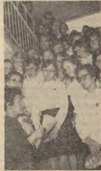
stali do nich dobrze przygotowani. Zegnamy maturzystów XIII LO. Zyczymy im oraz wszystkim łódzkim maturzystom powodzenia w dzisiejszym egzaminie z matematyki.

MUZEUM HISTORII WŁÓKNIENIA (ul. Piotrkowska 282) czynne od 10-17. MUZEUM SZUKI (Wieżekow skiego 36) - czynne w godz. 10-17. MUZEUM RUCHU REWOLUCYJNEGO (Gdańska 13) - Wystawa „Gen Świerczewski - Walter“ - czynna od godz. 9-15.