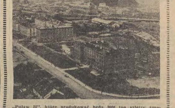
„Pulaw II”, które produkować będą 3600 ton saletry amonowej na dobę. Elektrownia „Tarów” osiągnęła moc 1400 MW. 4 września otwarto w Warszawie tysiączną szkołę Tyśiąclecia. Zielona Góra otrzymała wyższą uczelnię, jest nią WSI. 4 grudnia oddano dwunastą, wybudowaną po wojnie, kopalnię „Moszczenica”.

W dniu 1 stycznia 1965 roku ludność Polski liczyła 21.339 tys. osób. Stan oszczędności w PKO — 37 mld zł. W Łodzi podjęła normalną produkcję fabryka włókna syntetycznego „Anilana”. 11 lipca położono kamień węgielny pod budowę