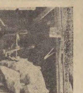
W rejonach przygranicznych toczą się walki, jednak brak jest szczegółowych danych o ich wynikach...