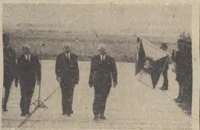
23 bm. opuściła nasz kraj delegacja partyjno - państwowa CSRS, która przebywała w stolicy w związku z obchodami 25-lecia PRL. Niz: (od prawej) L. Svoboda, G. Husak i M. Spychalski przechodzą przed frontem kompanii honorowej na lotnisku Okęcie.

Ministrowie spraw zagranicznych krajów wspólnego rynku rozpoczęli we wtorek dwudniową sesję, pierwszą od chwili objęcia przez Pompidou urzędu prezydenta Francji. Agencje zachodnie podają, że w zasadzie doszło do porozumienia w sprawie zwolnienia szczytu „szóstki” w celu dyskusyjnego rozwiązania problemów wspólnoty, łącznie z przyjęciem W. Brytanii do tej organizacji.