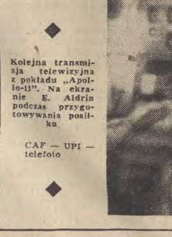
Kolejna transmisja telewizyjna z pokładu „Apollo-11”. Na ekranie E. Aldrin podczas przygotowywania posiłku.

W ciągu ostatnich dwóch dni na drogach i jezdnich całego kraju wydarzyło się 80 poważniejszych wypadków drogowych, w których 22 osoby, w tym czworo dzieci, zginęły, a 87, w tym sześćdziesiąt dzieci, odniosło obrażenia.