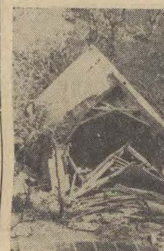
Największy w historii Stanów Zjednoczonych huragan „Camille” spowodował wielkie straty. Na zdjęciu: zniszczenia w Biloxi w stanie Mississippi.