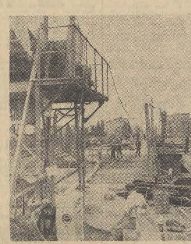
Do zakończenia budowy wiaduktu przy ul. Kopecińskiego pozostało ponad 4 miesiące. Na zdjęciu: Kładzenie nawierzchni na jednej z części obiektu.