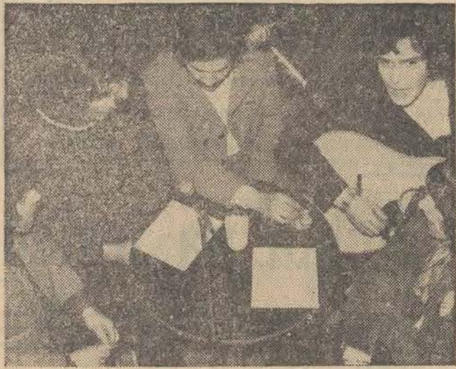
N.z.: NoToCo podczas prób.

JAZZ I BEAT INSTYTUCJA. W ostatnich dniach STOWARZYSZENIE WSPÓŁCZESNEJ MUZYKI RYTMICZNEJ p. u. ŁÓDZKI KLUB JAZZOWY uzyskało osobowość prawną stając się tym samym samodzielną organizacją artystyczną, zrzeszając zespoły muzyczne, symfoniczne, krytyków, teoretyków współczesnej muzyki rozrywkowej i jazzowej oraz sekcje jazzu i muzyki młodzieżowej przy domach kultury, ZMS, ZHP, ZSP itd.