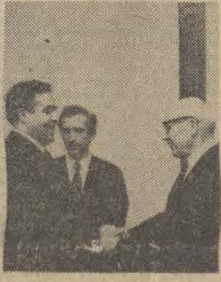
17 bm. Władysław Gomułka przyjął przybywającego w naszym kraju szefa państwa i rządu Syrii Nureddina Atassiego.

Na zaproszenie Komitetu Centralnego PZPR, Rady Państwa i rządu PRL przybyła w poniedziałek do Polski partyjno-rządowa delegacja Arabskiej Republiki Syryjskiej z sekretarzem generalnym Partii Socjalistycznej Odrodzenia Arabskiego — BAAS szefem państwa i rządu syryjskiego — Nureddinem Atassim.