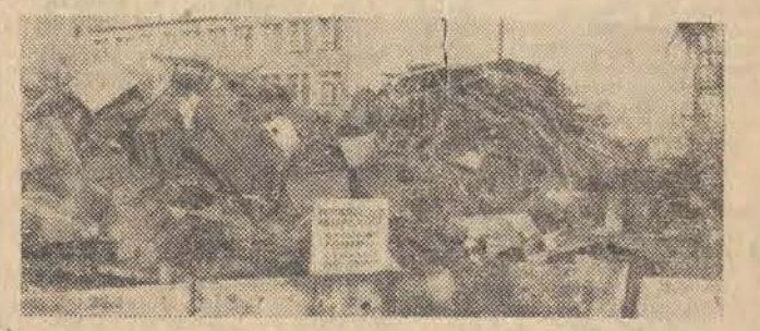
Ulica Obrońców Stalingradu nr 103/105. Duży — 2,5-hektarowy teren. Za bramą barak. To biuro. Obok kilka gospodarczych pomieszczeń. Dalej niewidoczny tor kolejowy, po którym już dawno nie jeździ pociąg. Za torem wśród ogromnych hałd złomu elektromagnetyczny dźwig.