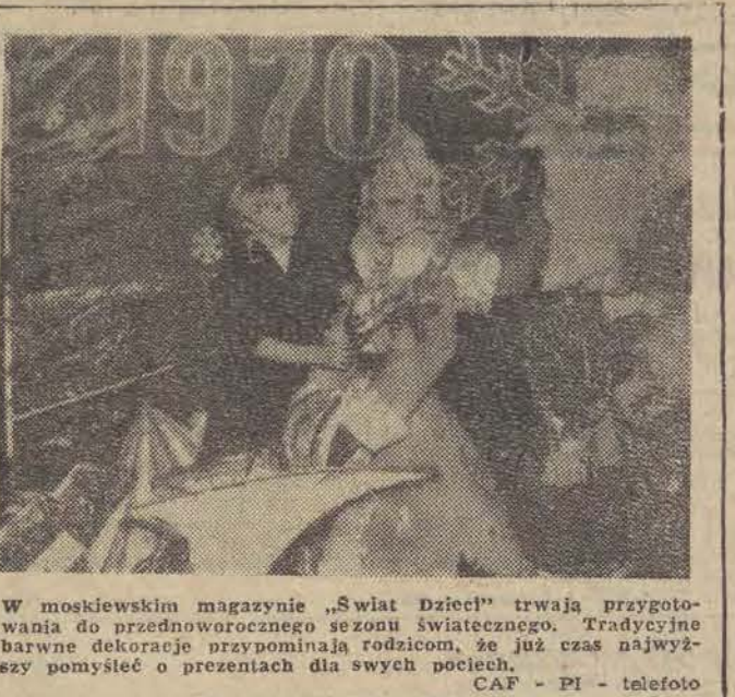
W moskiewskim magazynie „Swiat Dzieci” trwają przygotowania do przednowocznego sezonu swiatecznego. Tradycyjne barwne dekoracje przypominają rodzicom, że już czas najwyższy pomyśleć o prezentach dla swych pociec.

Zrealizowanie tego zamierzenia nie jest jednak łatwe. Od lat uczelnie techniczne przyjmują bowiem mniej osób niż wynika to z planów resortu. Główną tego przyczyną jest słabe przygotowanie kandydatów, niższe niż maturzystów starszących się o przyjęcie na studia dzienne. Uczelnie zmuszone są do organizowania dodatkowych egzaminów wstępnych w okresie powakacyjnym. Dopiero w br. po raz pierwszy udało się zapelnic wszystkie miejsca na studiach wieczorowych i 92 proc. miejsc - na zaocznych. Podkreślono, że należy usprawnić (Dalszy ciąg na str. 2)