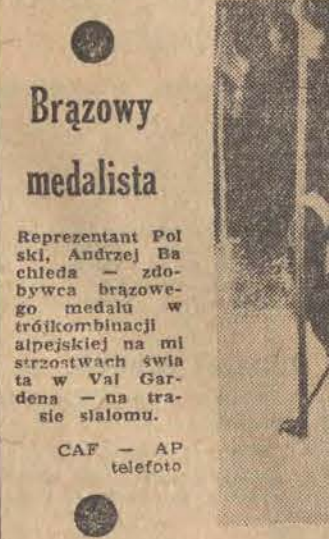
Reprezentant Polski, Andrzej Bachleda - zdobywca brązowego medalu w trójkombinacji alpejskiej...