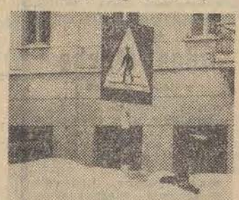
Centrum Warszawy 3 marca 1970 roku. CAF - Sokółowski - telefoto

drodze pod Łuźmierzem ciągnęła się niemal 4 km. Do oczyszczenia bieżących tam torów tramwajowych przystąpili żołnierze łódzkiego pułku OTK. W innych, równie potężnych zaspach, ugrzęzły w całym kraju 144 autobusy, 3 z nich na terenie naszego województwa jeszcze w godzinach popołudniowych nie wróciły do baz.