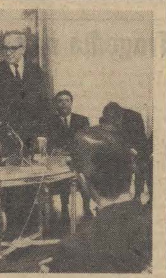
W Warszawie, w ostatnim dniu pobytu w naszym kraju min. Janos Peter spotkał się z dziennikarzami na konferencji, w czasie której odpowiadał na zadawane pytania. Na zdjęciu: min. J. Peter (z prawej) w czasie konferencji.

Zgodnie z ustaleniami zarządzenia, podstawowe prace nad opracowaniem dokumentów przebiegać będą w specjalnie do tego celu powołanych zespołach, w jednostkach — bezpośrednio nadzorujących zakłady pracy oraz w zespołach resortowych. Udział w pracach zespołów brać będą m. in. przedstawiciele branżowych związków zawodowych. Założenia systemu, jego cele i kierunki rozwiązań będą przedmiotem dyskusji z udziałem przedstawicieli zakładów pracy. Zarządzenie zawiera również zalecenia dla centralnych organizacji spółdzielczych, aby podjęły opracowanie analogicznych zasad bodźców materialnego zainteresowania w odniesieniu do jednostek spółdzielczych.