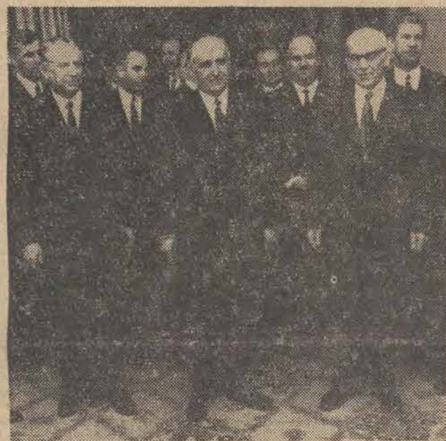
16 bm. delegacja partyjno-rządowa Bułgarii, bawiąca z wizytą przyjaźni w Polsce, złożyła wizytę w KC PZPR. N/Z: podczas wizyty. Od lewej Marian Spychalski, Todor Ziwicki i Władysław Gomułka.

NA ZAPROSIENIE KOMITETU CENTRALNEGO POLSKIEJ ZJEDNOCZONEJ PARTII ROBOTNICZEJ I RZĄDU POLSKIEJ RZECZYPOSPOLITEJ LUDOWEJ PRZYBYŁA W PONIEDZIAŁEK DO POLSKI Z OFICJALNĄ WIZYTĄ PRZYJAŹNI DELEGACJA PARTYJNO-RZĄDOWA LUDOWEJ REPUBLIKI BULGARII POD PRZEWODNICTWEM I SEKRETARZA KOMITETU CENTRALNEGO BULGARSKIEJ PARTII KOMUNISTYCZNEJ, PRZEWODNICZĄCEGO RADY MINISTRÓW LRB, TODORA ZIWKOWA.