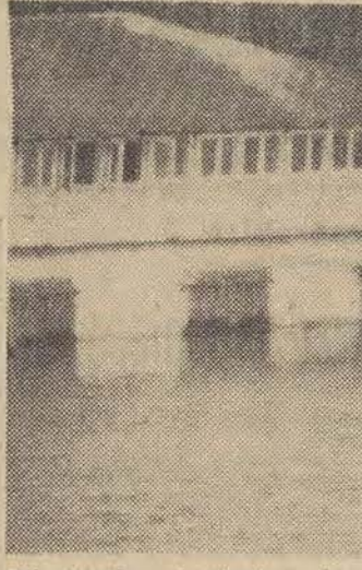
Na zdjęciu: na przedmieściu Ostrołęki woda wdziera się do domów.