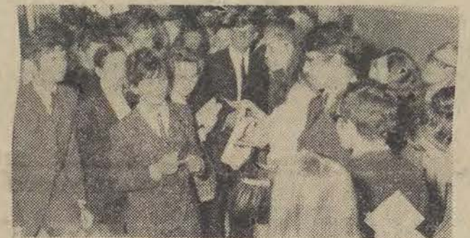
Na zdjęciu: przed egzaminem na I rok filologii UL.

W CZWARTEK ROZPOCZĘŁY SIĘ W CAŁYM KRAJU EGZAMINY WSTĘPNE DO SZKÓŁ WYŻSZYCH. MIMO BRAKU TEGOROCZNYCH ABSOLWENTÓW LICEÓW OGÓLNOKSZTAŁCĄCYCH – LICZBA OSÓB STARAJĄCYCH SIĘ O PRZYJĘCIE DO SZKÓŁ WYŻSZYCH PRZEKRÓCZYŁA WSZELKIE OCZEKIWANIA. NA WIELU WYDZIAŁACH NOTUJE SIĘ WRĘCZ REKORDY ZGŁOSZEŃ, BOWIEM NA 1 WOLNE MIEJSCE PRZYPADA NIEJEDNOKROTNIENIE PONAD 10 KANDYDATÓW. WALKA O INDEKSY JEST WIĘC BARDZO OSTRA. EGZAMINY WE WSZYSTKICH UCZELNIACH PRZEPROWADZANE SĄ ANONIMOWO. LICZY SIĘ WIĘC TYLKO WIEDZA.