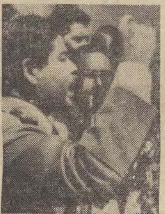
Przywódca lewicowego ugrupowania w armii, generał Torrez wygłosił z balkonu pałacu prezydenckiego przemówienie do mieszkańców La Paz.

szkość nowych ministrów reprezentuje siły lewicowe — główne źródło poparcia prezydenta Torreza. W skład nowego rządu wchodzi trzech ministrów, którzy znajdowali się w składzie poprzedniego gabinetu prezydenta Ovando Candii.