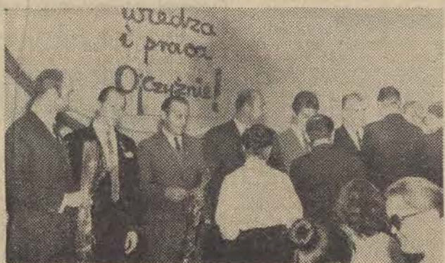
Uroczysty moment wręczenia odznaczeń.