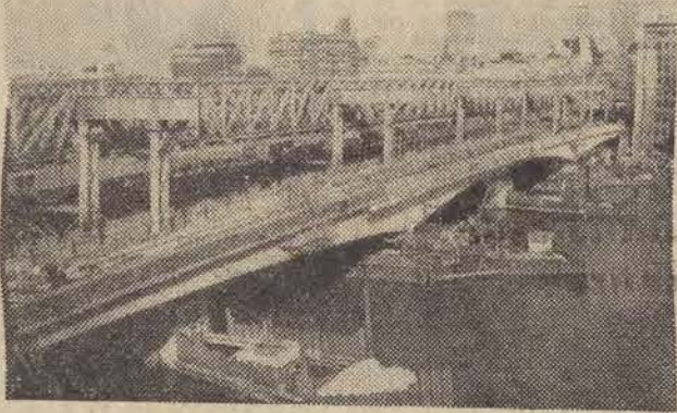
Most na Tamizie, który zastąpi dawny London Bridge z 1831 roku będzie miał trzy prześła, zbudowane z 358 betonowych segmentów. Budowa zostanie zakończona w 1973 roku. Stary most jest stopniowo demontowany i transportowany do Arizony (USA), gdzie po rekonstrukcji odgrąwać będzie rolę turystycznej atrakcji Lako Havasu City.