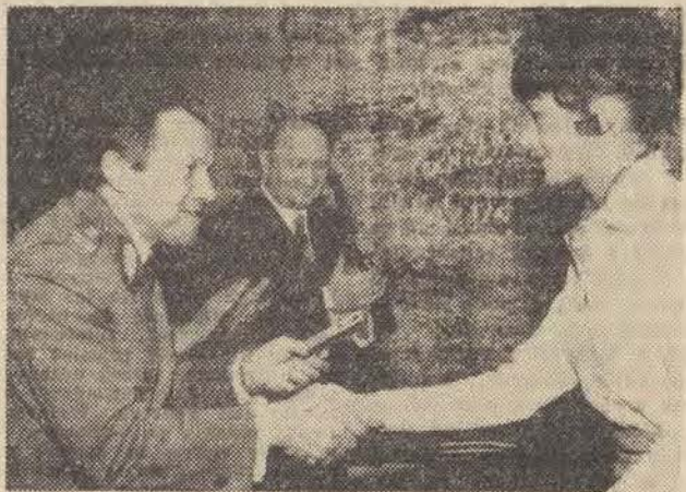
W Zakładach Odzieży Sportowej w Łodzi powołana została onegdaj organizacja ORMO. Uroczystego uroczono legitymacji członkowskich...