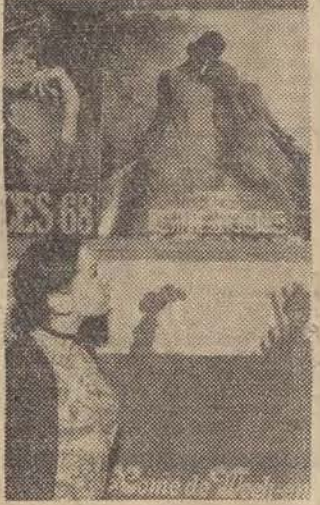
W MUZEUM HISTORII WŁÓKIENICTWA CZYNNA JEST WYSTAWA WSPÓŁCZESNEJ UŻYTKOWEJ SZTUKI BELGIJSKIEJ. EKSPONOWANE SA: TKANINY, PLAKATY, CERAMIKA I RZEZBA W DRZEWIE. NA ZDJĘCIU: PLAKATY REKLAMOWE.

Je kwota pozostająca do spłaty. W podanym przypadku wynosi 328 zł i o tę kwotę zmniejsza się należność klienta. Ponieważ spłaca on raty w wysokości 300 zł miesięcznie, przedostatnia rata będzie niższa o 28 zł, a ostatnia całkowicie umorzona.