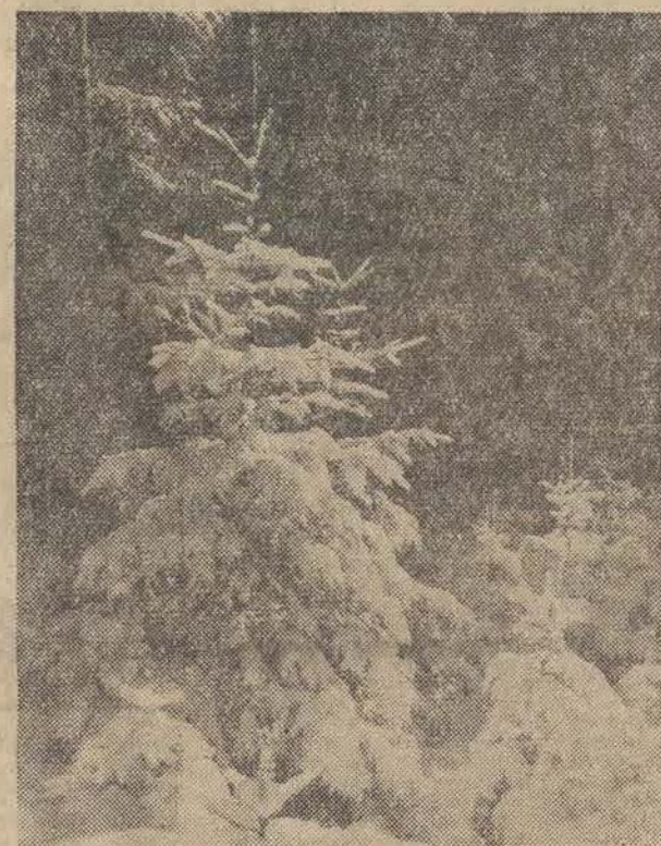
Choinka - jak zawsze najpiękniejsza w lesie.