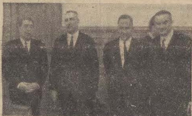
Na zdjęciu: przed rozmowami na Kremlu. Od lewej: L. Breżniew, E. Gierek, A. Kosygin i P. Jaroszewicz.

Warszawskiego i Rady Wzajemnej Pomocy Gospodarczej. Towarzysze polscy udzieliłi informacji o aktualnych tendencjach budownictwa gospodarczego i społecznego Polski Ludowej, o posunięciach gospodarczych i społecznych dokonywanych przez KC PZPR i Radę Ministrów PRL po VII Plenum KC PZPR w interesie klasy robotniczej, ludzi pracy (Dalszy ciąg na str. 2)