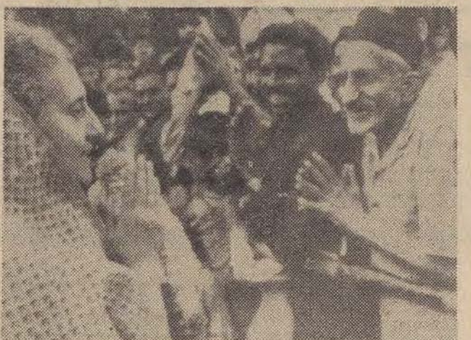
Na zdjęciu: premier Indii, pan Indira Gandhi przyjmuje gratulacje od swoich zwolenników.

Zdecydowane zwycięstwo Kongresu w indyjskich wyborach powszechnych zaskoczyło nawet partię rządzącą, której rzeczn-