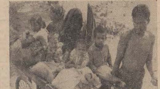
Jedną z rodzin ze wsi Jessore we Wschodnim Pakistanie opuszcza swoją wioskę, w pobliżu której toczą się walki między oddziałami rządowymi a separatystami wschodniopakijskimi.

Coraz częściej napływają doniesienia świadczące, że w Pakistanie toczą się zaciełe walki i że armia pakistańska została zepchnięta do defensywy. Ochotnicze oddziały Ligi Awami panują niepodzielnie na prowincji i zdołali już odzyskać wiele mniejszych miast. W poniedziałek — według indyjskiej agencji PTI — zaciełe walki toczyły się wokół miejscowości Sylhet, Kusztia, Dinajpur i Rangpur. To ostatnie miasto zostało opanowane przez zwolenników szajka Rahmana, którzy zadali przeciwnikowi znaczne straty. Armia pakistańska wycofuje się pośpiesznie spod Rangpur otwierając sobie drogę przy pomocy artylerii i lotnictwa. Kilka innych garnizonów pakistańskich obawiając się okrążenia porzuciło swe stanowiska wycofując się w kierunku własnych sił głównych.