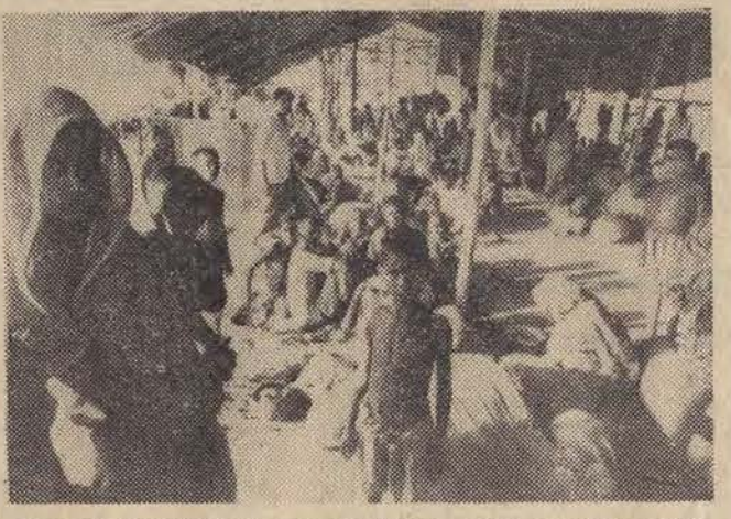
Obóz dla uchodźców w Benapal (Indie), gdzie znalazło schronienie ponad 5000 Bengalczyków, którzy całymi rodzinami opuszczali tereny Pakistanu Wschodniego objęte wojną domową.