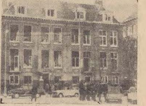
Na zdjęciu: zniszczony budynek, z oknami bez szyb, przed nim dwa uszkodzone samochody personelu przedstawicielstwa.

Amsterdamie oraz kondolencje dla pracowników tej placówki, którzy ucierpieli wskutek tego aktu. Rząd Holandii wyraża równocześnie gotowość wyrównania szkód materialnych spowodowanych podczas tego zbrodniczego aktu w gmachu przedstawicielstwa handlowego ZSRR.