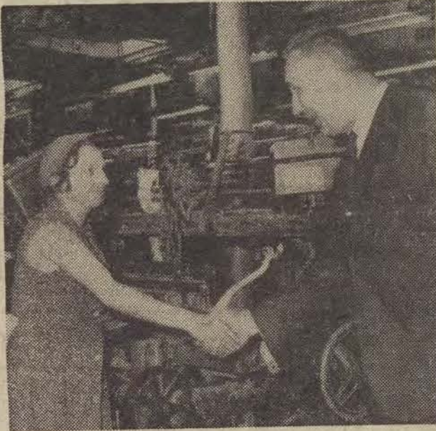
E. Gierek w ZPB im. Obr. Pokoju