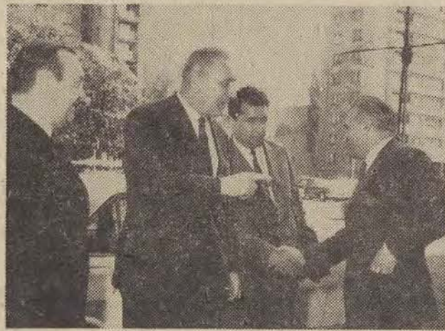
E. Gierek zwiedza miasto