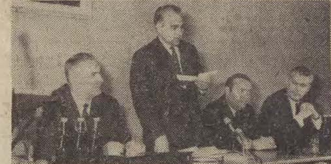
Spotkanie z aktywnym w KŁ PZPR