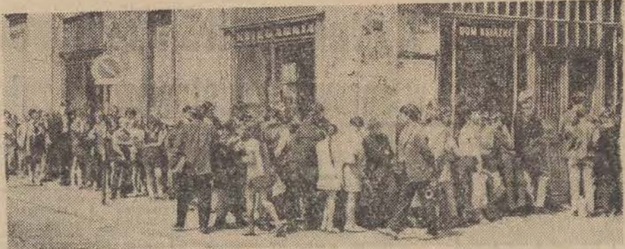
Jedyny w Łodzi punkt skupu i sprzedaży używanych podręczników przeżywa w tych dniach okres wzmożonej pracy. Codziennie przez księgarnię „Domu Książki” przy ul. Piotrkowskiej 193 przewija się 200-300 klientów. W samym tylko czwartku, księgarnia zakupiła podręczniki za sumę 120 tys. zł, natomiast sprzedano książki za sumę 42 tys. zł. Jak widać na zdjęciu, „obłożenie” księgarni nadal trwa. Czy nie warto byłoby uruchomić do Łodzi jeszcze kilku podobnych punktów, tym bardziej że we wrześniu przewiduje się drugi „szczyt” w handlu używanymi podręcznikami? (ms)