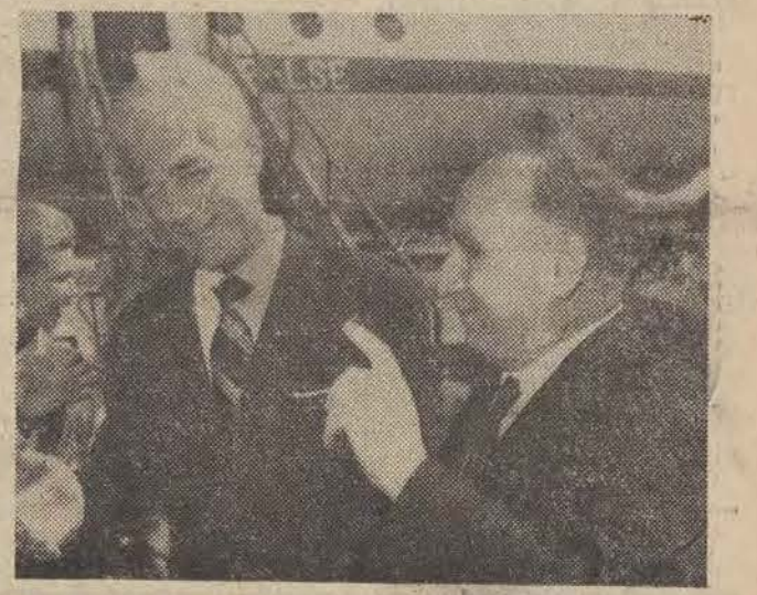
Na lotnisku Okęcie gościa powitał minister S. Jędrzychowski.

Tematem drugiego programu telewizyjnego z cyklu „TRYBUNA OBYWATELSKA” będą społeczno-gospodarcze sprawy wsi i rolnictwa. W programie, który nadany będzie 14 lipca o godz. 20.00 spotkamy się z sekretarzem Komitetu Centralnego PZPR