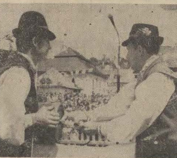
5 bm. zakończył się w Kazimierzu nad Wisłą IV Festiwal Kapel i Spiewaków Ludowych. Na zdjęciu: burczybasy - to instrument na którym trzeba grać we dwóch. Na estradzie kapela „Kaszuby” z Kartuz (woj. gdańskie) - III nagroda kapel stylizowanych.

Bardziej szczegółowy program, jaki w tej sprawie przygotowuje rząd, zostanie przekonsultowany z organizacjami społeczno-zawodowymi działającymi na wsi i z samymi rolnikami.