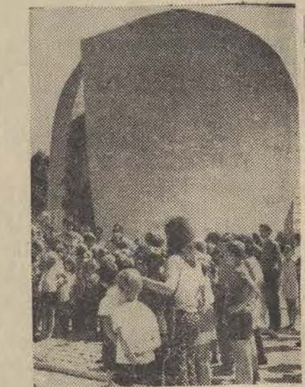
Złożyły one hołd pomordowanym tu dzieciom przez hitlerowców w czasie okupacji.

Służbę biletorską w naszym cyрку pełnią artyści i technicy namiotowi, stanowiący stały trzon naszego zakładowego personelu. Cyрк nasz gościł już w CSRS, Rumunii, Węgrzech