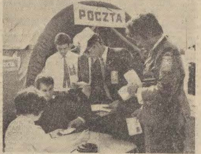
Na zdjęciu: poczta w Miasteczku Złotowym - stąd wychodzą listy w całą Polskę.