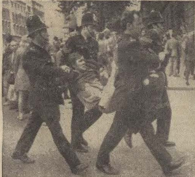
N/z: policjanci niosą do karetki policyjnej jednego z aresztowanych uczestników wieceu protestacyjnego w Londynie przeciwko internowaniu.

16 bm. odbyło się w Warszawie w kinie „Skarb” pierwsze losowanie premiowych bonów oszczędnościowych PKO (na zdjęciu). Główne wygrane po 200 tys. zł padły na nr nr 799.361 (woj. bydgoskie) i 949.964 (woj. warszawskie). Wygrane po 100 tys. zł padły na nr nr 166.887 (woj. wrocławskie), 231.042 (woj. warszawskie), 284.151 (woj. poznańskie), 605.915 (woj. białostockie), 649.080 (woj. warszawskie) 844.024 (woj. katowickie). Podstawę do wypłacenia premii stanowi urzędowa tabela wygranych centrali PKO, w której umieszczone zostaną wszystkie premie. Ogółem w każdej emisji jest ich 2.100 na łączną kwotę 71 mln zł. Obecnie w sprzedaży znajdują się już bono drugiej emisji; następne losowanie przypada za 6 tygodni, tj 30 września br. W drugim ciągnięciu premii będą brały udział zarówno bono kupowane obecnie jak i nabyte przed pierwszym losowaniem. Za zainteresowanie tą nową formą premiowanego oszczędzania jest nadal duże.