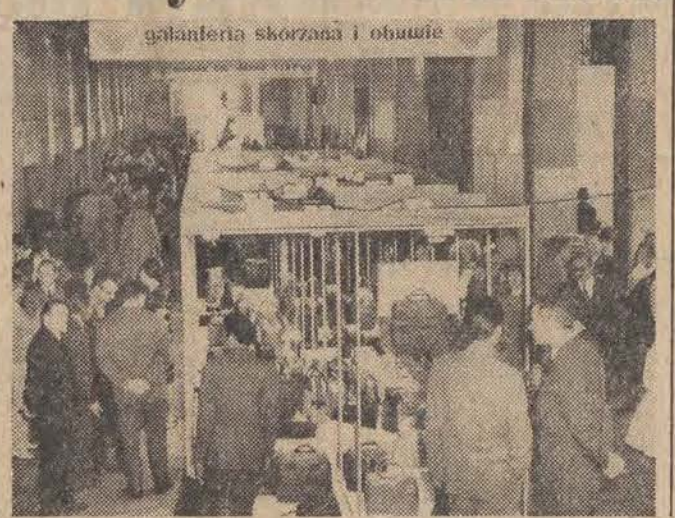
W dniu wczorajszym otwarta została w naszym mieście Giełda Towarowa Drobnej Wytwórczości. (O szczegółach czytaj na str. 4.