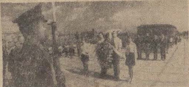
1 bm., w 32 rocznicę Września, społeczeństwo całego kraju oddało hołd żołnierzom poległym w walce z hitlerowskim najeźdźcą. N/z: uroczystość składania wienców pod pomnikiem Nike.

Centralne obchody odbyły się na Westerplatte, gdzie podczas uroczystości pod pomnikiem złożona została urna z prochami mjr. Henryka Sucharskiego.