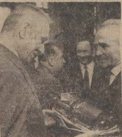
N/z: E. Gierek otrzymuje model turbiny od I sekretarza organizacji partyjnej w Elektrowni Siersza.